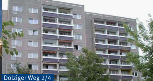
Dölziger Weg 2/4